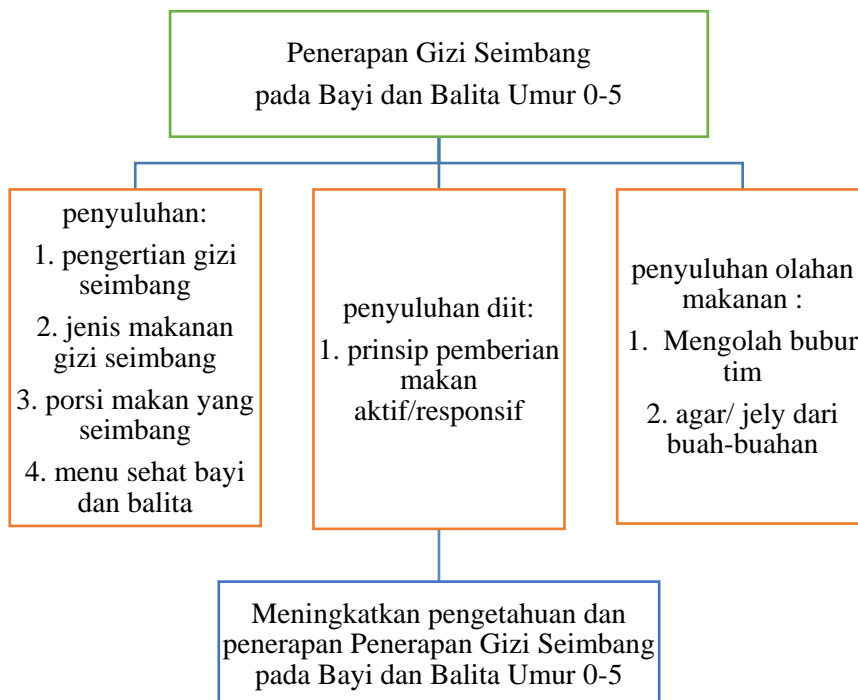
Gambar 2. Kerangngan Pemecahan Masalah Penerapan Gizi Seimbang