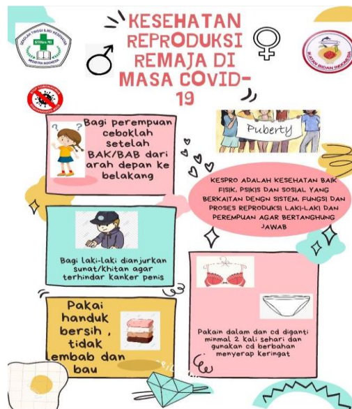
Gambar 1. Poster tentang Edukasi Kesehatan Reproduksi Remaja di Masa Covid-19

Pelaksanaan pengabdian masyarakat dilaksanakan dengan pemaparan materi dan tahap diskusi yang dilaksanakan secara daring dengan tema Edukasi Kesehatan Reproduksi Remaja di Masa Covid-19.