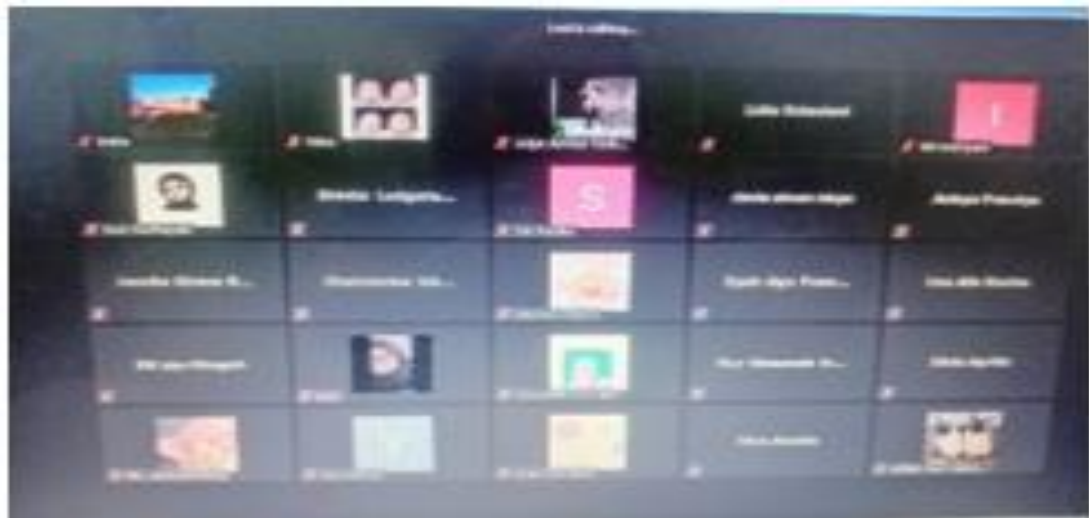
Gambar 2. Kegiatan Pelaksanaan Penyuluhan Edukasi Kesehatan Reproduksi Remaja di Masa Covid-19 : Peserta penyuluhan 76 orang.

Pelaksanaan pengabdian masyarakat dilaksanakan dengan pemaparan materi dan tahap diskusi yang dilaksanakan secara daring dengan tema Edukasi Kesehatan Reproduksi Remaja di Masa Covid-19.