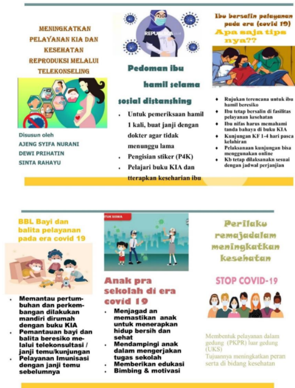
Gambar 1. Leaflet tentang meningkatkan pelayanan KIA dan kesehatan reproduksi melalui telekonseling pada era Covid-19

Sebelum melakukan edukasi telah terstruktur rencana penyuluhan ini diantaranya di adakan pre-test . Kemudian membagikan leaflet sebagai ringkasan pengetahuan dari materi yang di sampaikan melalui daring tersebut. Materi utama dibuat dalam media leaflet. (Gambar 1)