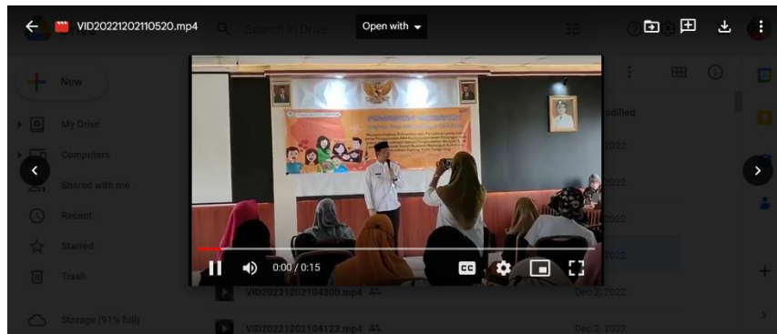
FOTO DAN VIDEO